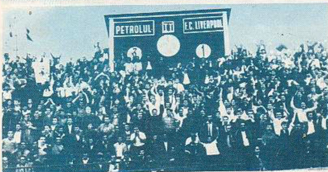
... provocând explozia de bucurie a tribunelor